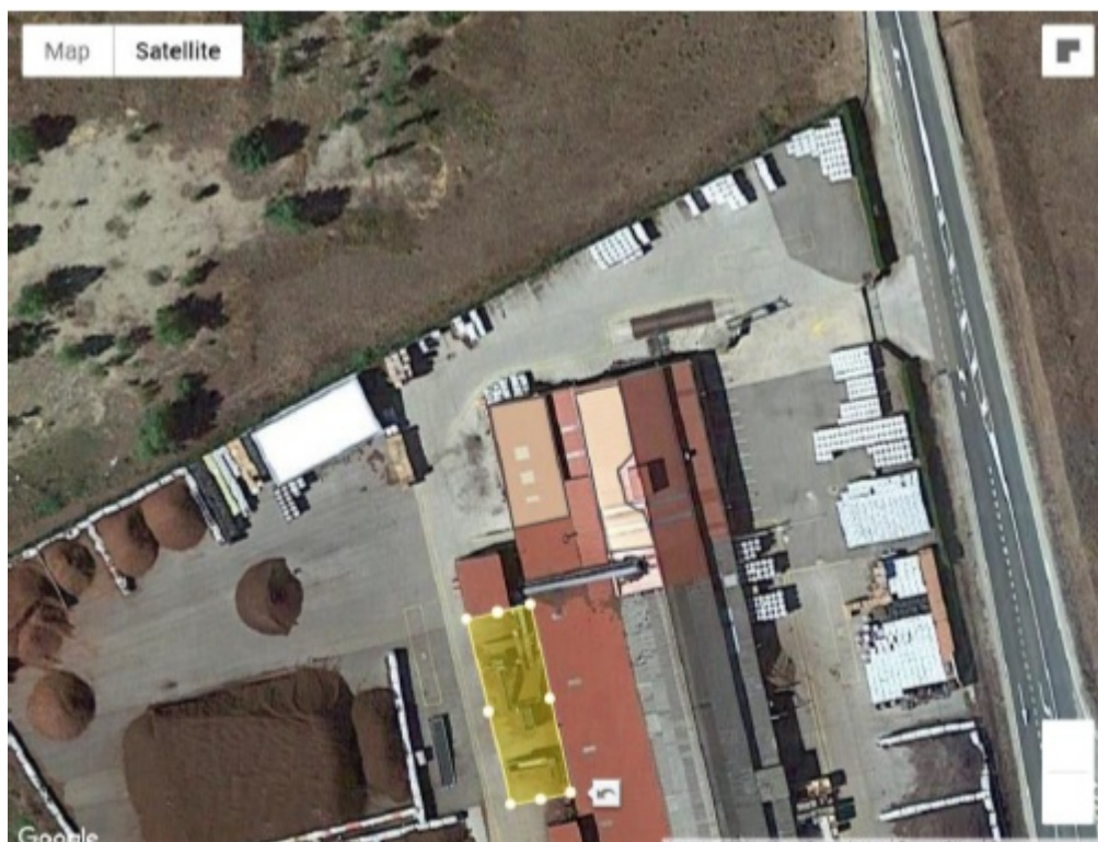
Den gule firkant indikerer, hvor solpanelerne vil blive installeret på vores fabrik i Burgos i Spanien.

Vores arbejde med vedvarende energi er en løbende proces, og vi ser frem til at få praktisk indsigt og knowhow, som vi vil tilstræbe at udnytte på tværs af Pindstrup-koncernen, når vi fremadrettet arbejder med vedvarende energi.